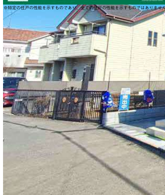
カーナビ入力 東京都町田市南大谷 1-37-2 付近