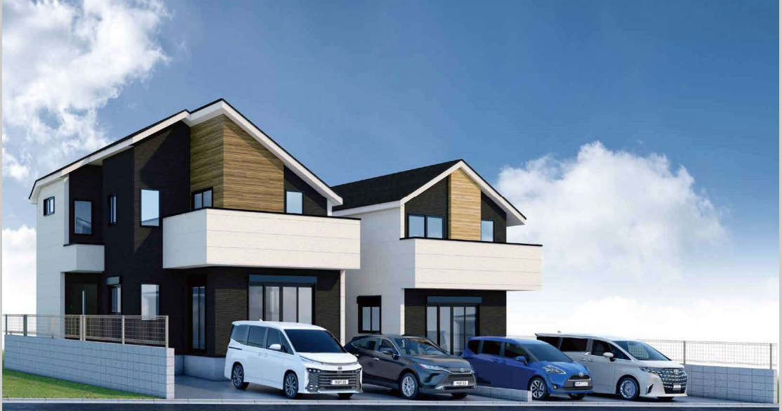
※バスはイメージです