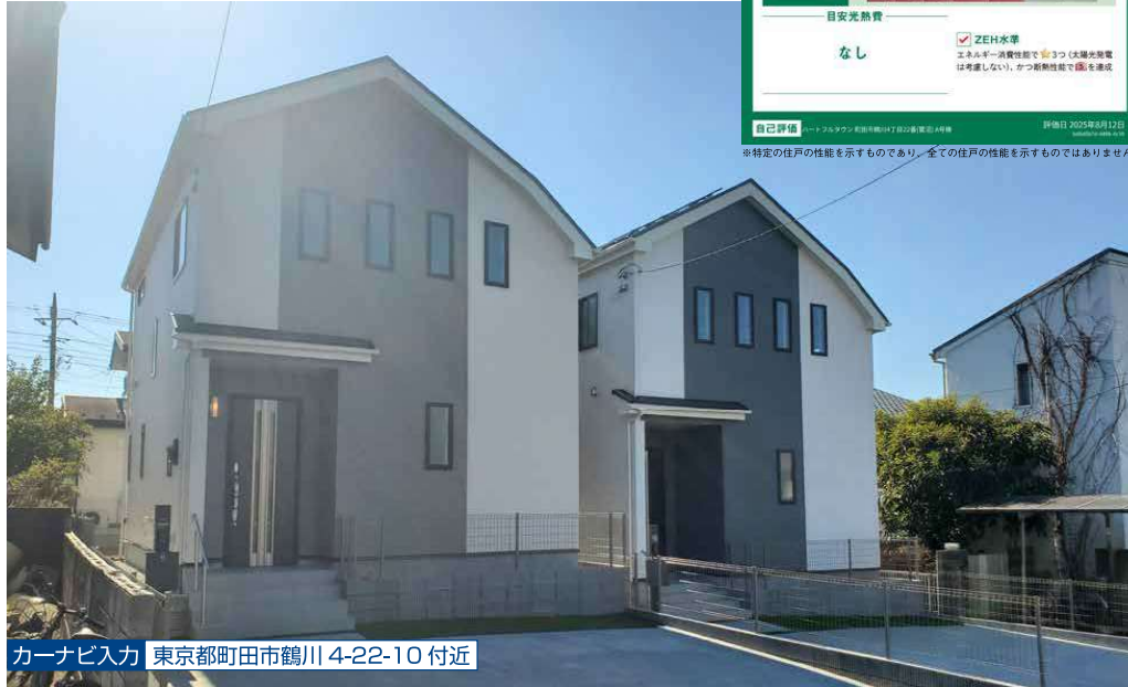
カーナビ入力 東京都町田市鶴川4-22-10付近