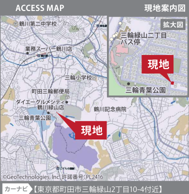
カーナビ【東京都町田市三輪緑山2丁目10-4付近】